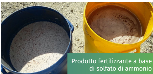
Prodotto fertilizzante a base di solfato di ammonio

Il trattamento è stato testato per 2 anni in cicli di ingrasso di suini per la filiera del prosciutto di Parma DOP, con la produzione di un fertilizzante a base di solfato di ammonio con la tecnologia del lavaggio ad aria, e si è proceduto alla caratterizzazione chimica. La soluzione di solfato di ammonio recuperato ha ridotto le emissioni di gas serra sostituendo i concimi industriali a base di azoto.