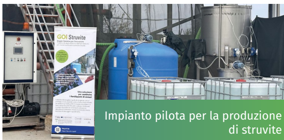
Impianto pilota per la produzione di struvite

Una nuova tecnologia è stata sviluppata per produrre un fertilizzante organico che va sotto il nome di struvite ( \text{NH}_4\text{MgPO}_4 \cdot 6\text{H}_2\text{O} ). Si tratta di un fertilizzante rinnovabile a base di azoto, fosforo e magnesio a lento rilascio che può essere impiegato in agricoltura in sostituzione dei concimi di sintesi nelle aree caratterizzate da deficit di nutrienti. Secondo l'esperienza maturata, l'efficienza di recupero del fosforo e dell'azoto è risultata essere maggiore con una pre-acidificazione del digestato, passando da un pH 8,5 iniziale a un pH 7,5, e con una successiva microfiltrazione per rimuovere i solidi. L'aggiunta di magnesio e di una base, per incrementare il pH da 7,5 a 9, promuove lo sviluppo di cristalli che successivamente precipitano. I nutrienti, azoto,