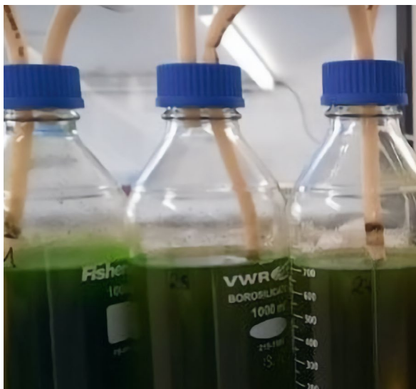
Coltivazione di microalghe usando l'estratto vegetale su scala di laboratorio

La tecnologia innovativa sviluppata consente di separare la frazione liquida estratta dai tessuti vegetali dalla frazione fibrosa, mediante una sequenza di sedimentazione, filtrazione e regolazione del pH. L'estratto vegetale ricco in nutrienti può trovare impiego nelle aziende agricole come fertilizzante alternativo per la coltivazione di alghe; queste ultime possono essere prodotte localmente e vendute come mangime ad alto contenuto proteico, sostituendo l'importazione di proteine.