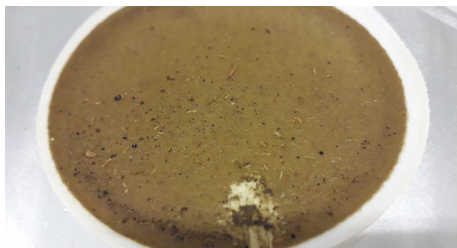
Stadio di raffinazione del precipitato ricco di struvite

fosforo e magnesio, si concentrano proprio nel precipitato ottenuto. A questo punto, sia il fosforo che l'azoto risultano sospesi nella soluzione salina in una forma più stabile e non più nelle forme ortofosforica e ammoniacale.