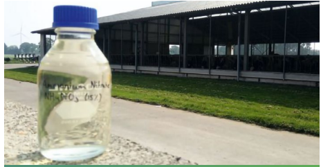
Nitrato di ammonio recuperato dal processo di strippaggio