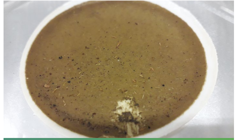
Etapa actual de refinament d'estruvita precipitat ric en estruvita