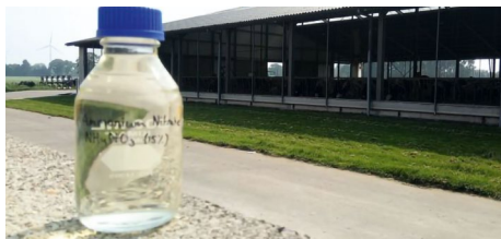
Les sals d'amoni es produeixen a partir del procés de stripping - scrubbing