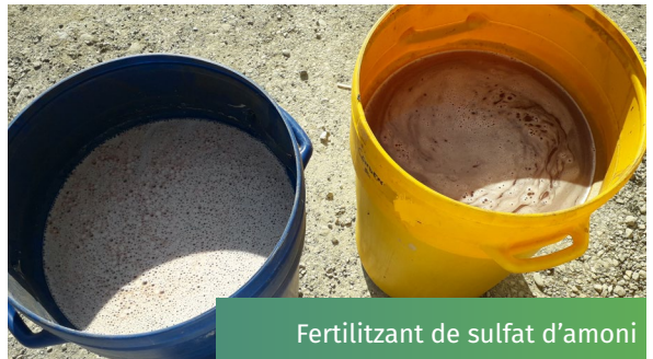
Fertilitzant de sulfat d'amoni

El tractament es va provar durant 2 anys en cicles d'engreixament de porcs per a la cadena de subministrament de pernil DOP Parma, i va produir fertilitzant de sulfat d'amoni utilitzant tecnologia de rentat per aire. La solució de sulfat d'amoni recuperada va reduir les emissions de GEH en reemplaçar els fertilitzants industrials nitrogenats.