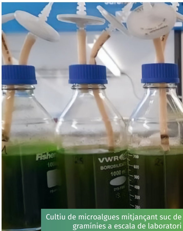
Cultiu de microalgues mitjançant suc de gramínies a escala de laboratori

Grass2Algae ha desenvolupat un enfocament nou per augmentar el valor de l'herba de baixa qualitat, que sol tenir un valor pobre per a l'alimentació animal i sovint es tracta com a residu. Aquesta nova tecnologia, instal·lada a la granja, permet separar la fracció líquida de l'herba de la fracció de fibra mitjançant una seqüència de sedimentació, filtració gruixuda i ajustaments de pH. Aquest suc d'herba ric en nutrients pot ser utilitzat pels agricultors com a fertilitzant alternatiu per cultivar algues que es poden produir localment a la granja i utilitzar o vendre com a aliment animal amb alt contingut de proteïnes, desplaçant les importacions de proteïnes.