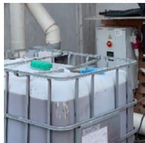
Producció de sulfat d'amoni