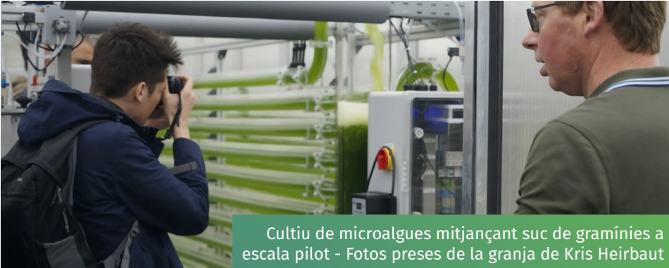
Cultiu de microalgues mitjançant suc de gramínies a escala pilot - Fotos preses de la granja de Kris Heirbaut