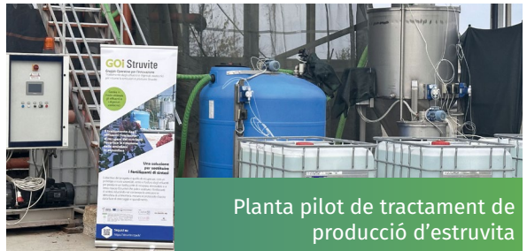
Planta pilot de tractament de producció d'estruvita

S'ha desenvolupat una nova tecnologia per produir un fertilitzant orgànic anomenat estruvita. ( \text{NH}_4\text{MgPO}_4 \cdot 6\text{H}_2\text{O} ). Aquest fertilitzant renovable recuperat, que és d'alliberament lent, té un alt contingut de nutrients clau com P, N i magnesi (Mg), que es poden utilitzar per substituir els fertilitzants sintètics en zones caracteritzades per deficiències de nutrients. L'eficiència de recuperació de P i N va ser més gran amb la preacidificació del digestat (el pH del digestat es va reduir a 7,5 des del valor inicial de 8,5) seguit de microfiltració per eliminar els sòlids. L'addició de Mg i alcalins (per augmentar el pH de 7,5 a 9) va afavorir el desenvolupament de vidres i la precipitació. El P, N i Mg es van concentrar al precipitat. En aquesta etapa, el P i el N estaven suspesos en solució salina, en forma estable i ja no en forma ortofosfòrica i d'amoniac.