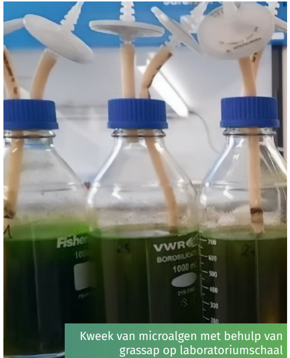
Kweek van microalgen met behulp van grassap op laboratoriumschaal

Grass2Algae heeft een nieuwe aanpak ontwikkeld om de waarde van bermgras of gras van lage kwaliteit, dat doorgaans een slechte voederwaarde heeft en vaak als afval wordt behandeld, te verhogen. Met deze nieuwe technologie op de boerderij kan de vloeibare fractie van gras worden gescheiden van de vezelfractie door middel van bezinking, grove filtratie en pH-aanpassingen. Dit voedingsrijke grassap kan door boeren worden gebruikt als alternatieve meststof om algen te kweken die lokaal op de boerderij kunnen worden geproduceerd en verkocht als eiwitrijk diervoeder, waardoor geïmporteerde eiwitten worden vervangen.