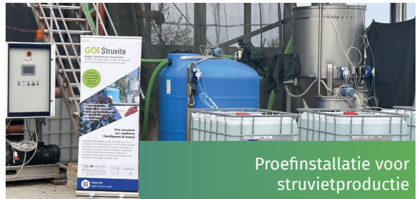
Proefinstallatie voor struvietproductie

Er is een nieuwe technologie ontwikkeld om een organische meststof te produceren, namelijk struviet productie ( \text{NH}_4\text{MgPO}_4 \cdot 6\text{H}_2\text{O} ). Deze langzaam vrijkomende, hernieuwbare meststof heeft een hoog gehalte aan de belangrijkste voedingsstoffen P, N en magnesium (Mg) en kan worden gebruikt ter vervanging van synthetische meststoffen in gebieden met een tekort aan voedingsstoffen. De efficiëntie van het terugwinnen van P en N was hoger bij het vooraf zuren van het digestaat om de beschikbaarheid van P te vergroten (pH van het digestaat verlaagd naar 7,5 van de beginwaarde van 8,5) gevolgd door microfiltratie om de vaste deeltjes te verwijderen. De toevoeging van Mg en base (om de pH te verhogen van 7,5 naar 9) bevorderde de ontwikkeling van kristallen en hun neerslag. Het