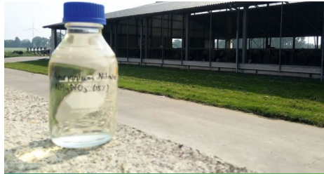
Ammoniumnitraat teruggewonnen uit het stripping-scrubbing proces