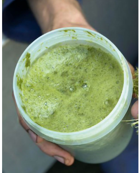
De vloeibare graswei wordt verzameld en verspreid als biologische meststof