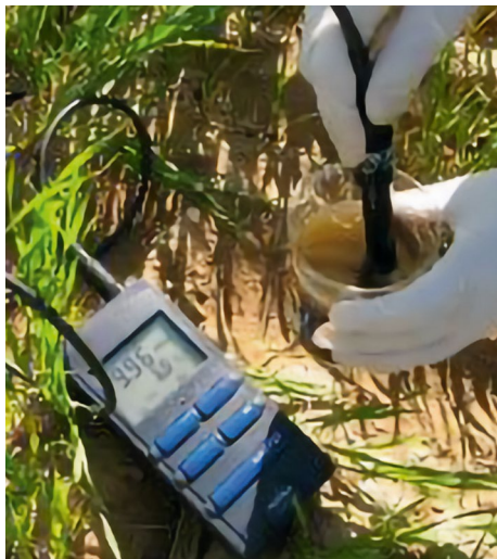
Utilisation sur le terrain d'un conductimètre manuel pour déterminer le taux d'application de fumier en fonction de la teneur en éléments nutritifs