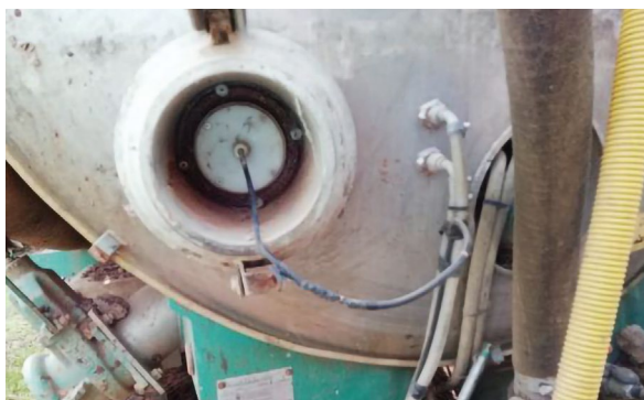
Conductimètre installé dans la cuve de transport

Une gestion bonne et efficace du fumier nécessite d'optimiser le transport pour réduire les distances, les temps de travail, la consommation de carburant et les coûts globaux. Cela minimise l'impact sur l'environnement et le fardeau économique des agriculteurs.