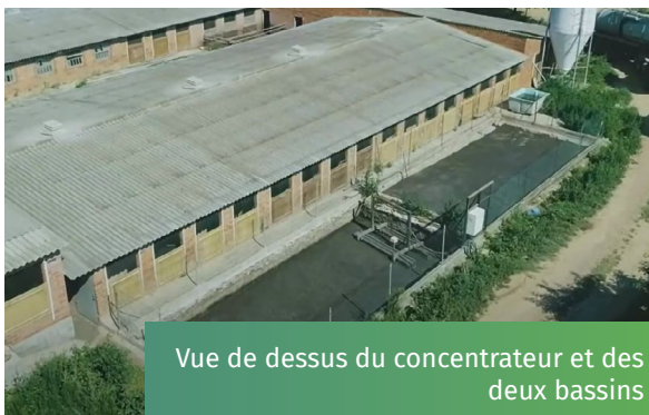
Vue de dessus du concentrateur et des deux bassins

Dans les régions à forte densité de bétail, il existe un déséquilibre entre la quantité de nutriments générés et les terres agricoles disponibles pour leur application. La gestion du fumier et du lisier constitue un défi spécifique pour les agriculteurs, en particulier ceux qui possèdent des exploitations de petite et moyenne taille. Il existe un besoin urgent de solutions efficaces qui améliorent et simplifient l'application de ces matériaux comme engrais et, si nécessaire, facilitent leur transport vers des zones déficientes en nutriments. Le Concentrateur de lisier a tenté d'apporter une solution innovante à ce défi qui consiste à séparer le fumier en deux phases: une phase semi-liquide (qui concentre l'essentiel de la matière organique et des nutriments) qui est transportée et épandue dans des champs éloignés où il n'y a pas de les nutriments sont disponibles; et une phase liquide (avec une faible concentration de nutriments) appliquée aux champs voisins. La gestion différenciée des deux phases vise à minimiser les coûts de transport et à optimiser l'application des nutriments au sol d'un point de vue agronomique et environnemental.